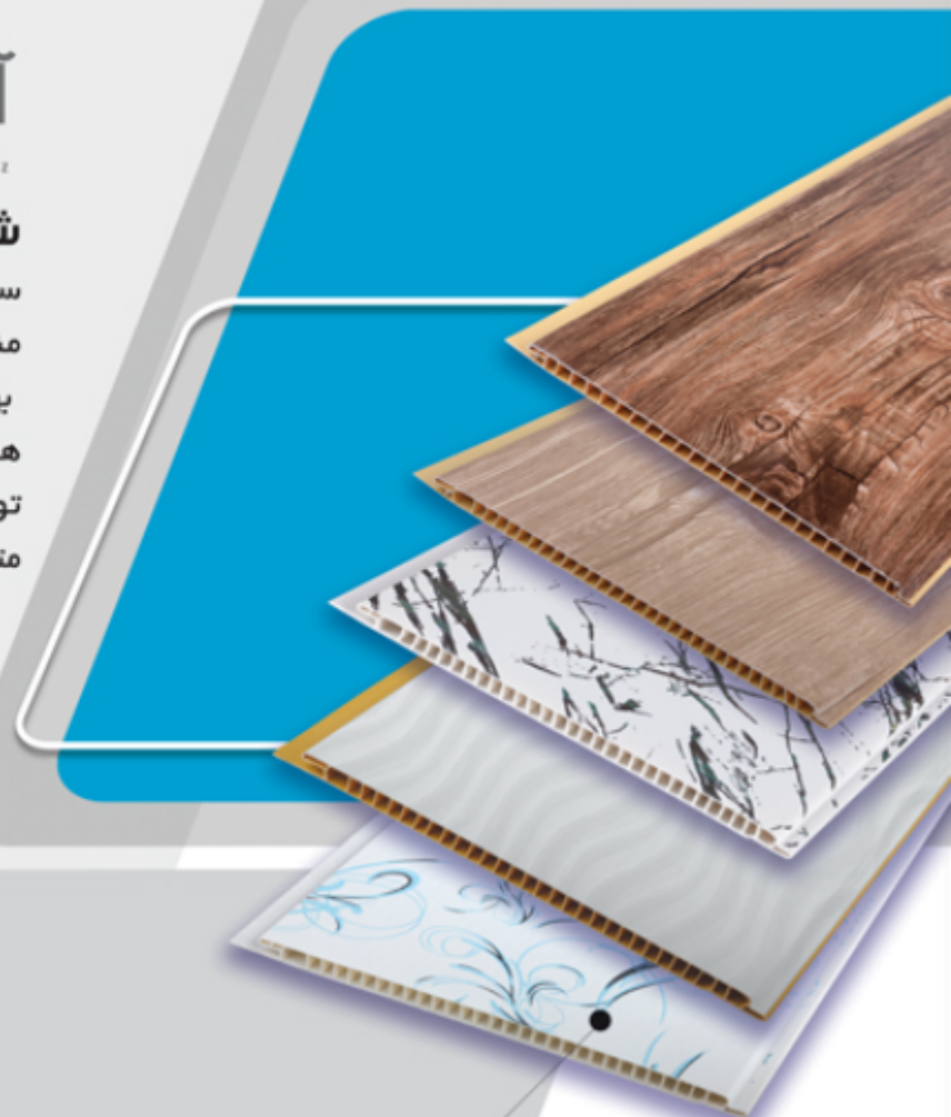
دیوارپوش عرض ۲۰ روکشدار

in the field of construction industry, with the tendency of interior decoration, with a global view and regional performance, by taking advantage of the acceptable standards of the country and taking advantage of the suggestions and points of view of experts and technicians, colleagues and customers, with the aim of production, supply, Sales and distribution of various wall coverings and false ceilings with various designs and shapes, started its activity in 2011